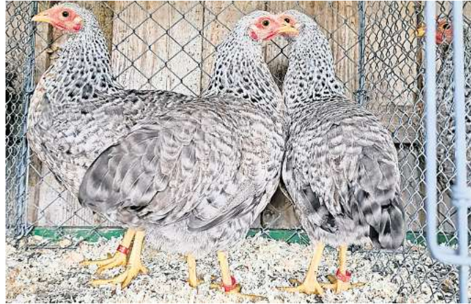
Der RGZV Bad Schwartau lädt zur Kleintierbörse ein.

Mit den Besucherzahlen ist er zufrieden. „Die Veranstaltung ist eigentlich immer gut besucht“, sagt er. Gern hätte