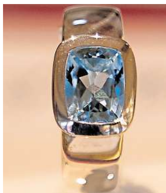
Juwelier Jürgen Helling bietet wunderschöne Blautopase an, die in Sterlingsilber gefasst sind.

Jürgen Helling hat diese verschiedenen Farbvarianten als Sky blue, Swiss blue und London blue vorrätig.