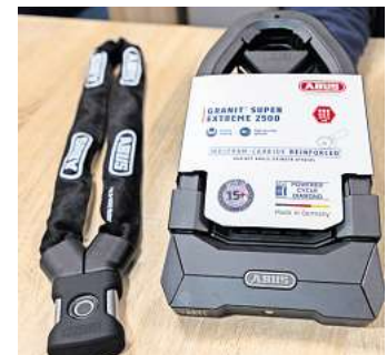
Sichere Schlösser von Abus beispielsweise mit Fingerabdrucksensor (links) und aus Wolframcarbid mit Level 15+ (rechts) sind neu beim Drahtesel erhältlich.