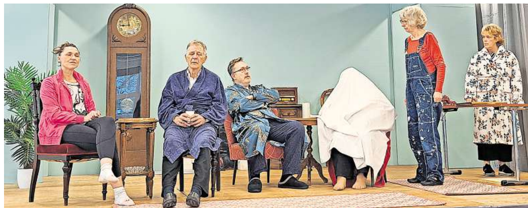
Was ist das Geheimnis von Cheatham Hall? Das lädt zum Mitraten ein.