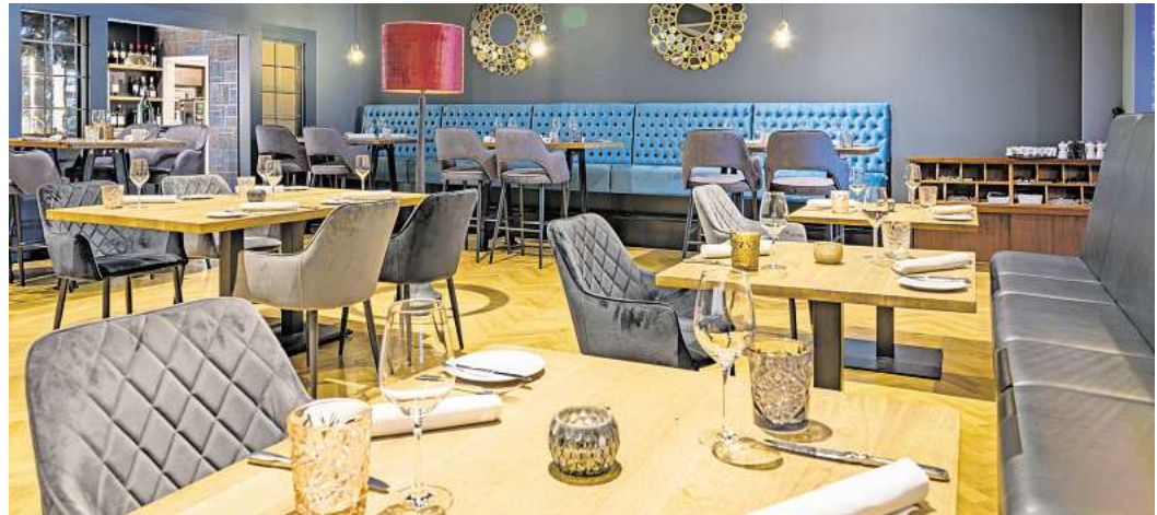
Gemütliche Atmosphäre im Restaurant Waldhotel Riesebusch.

Das Geflügel ist auf Vorbestellung täglich ab 12 Uhr mittags abholbereit. „Wir bieten unseren Gästen zudem die Möglichkeit, dass wir bei uns im Restaurant ab 17 Uhr die Enten und Gänse direkt am Tisch tranchieren.“ Selbstverständlich besteht