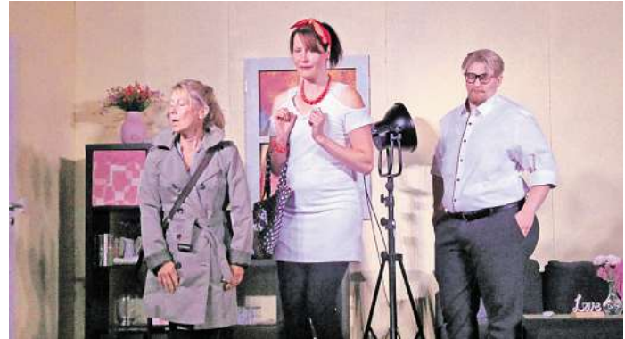
In der Komödie „Die lieben Eltern“ im Theater Fidelio geht es um Familie, Liebe, Gefühle und die Beziehung zwischen Eltern und Kindern.

Die Geschwister Paula, Julius und Luise lieben ihre Eltern abgöttisch. Doch als „die lieben Eltern“ ihre Kinder auffordern, schnellstmöglich zu ihnen zu kommen, weil sie ihnen etwas sehr Wichtiges mitzuteilen haben, fürchten sie das Schlimmste und beeilen sich, im Elternhaus einzufallen. Nach allerlei Ratselraten werden die Kinder von einer unerwarteten Nachricht überrascht. Was