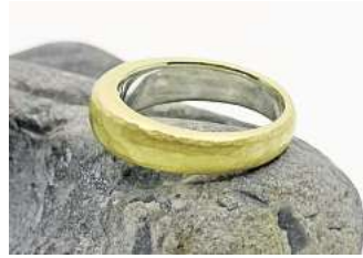
Der fertige, ummantelte Ring sieht durch den Hammerschlag besonders schön aus.

„Von Januar bis September diesen Jahres ist der Goldpreis um 20 Prozent ge-