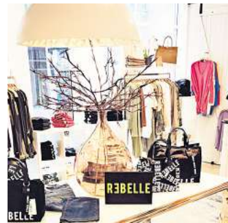
„Herzenswunsch“ stellt die neuen Rebelle-Taschen vor.

„Wir freuen uns auf Ihren Besuch. Am verkaufsoffenen Sonntag sind wir von 13 bis 18 Uhr für Sie da, um Sie bei italienischem Flair und einem Gläschen Prosecco