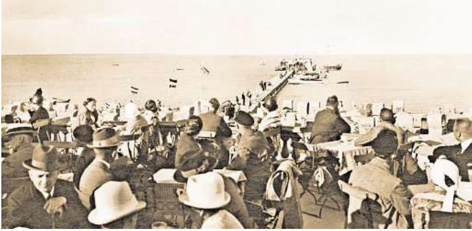
Die Terrasse vor der Seebücke Timmendorfer Strand – hier Ende der 20er Jahre – war einer der schönsten Aufenthaltsorte für die Urlauber.