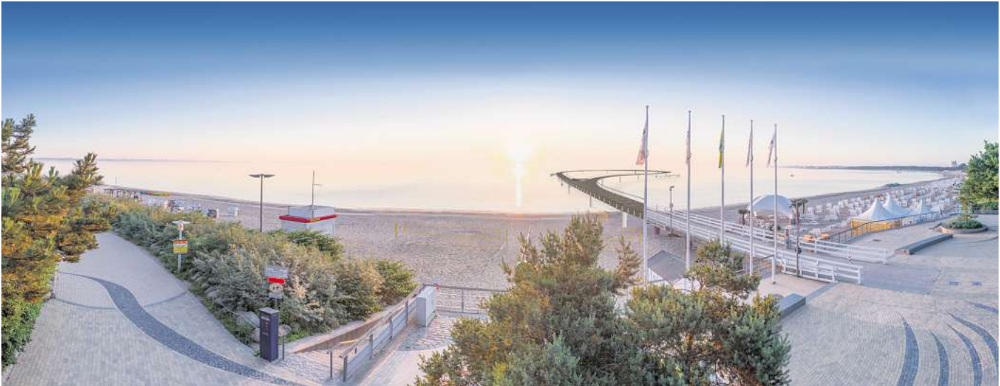
Es ist geschafft: Ab sofort überzeugt die neue Seebrücke nicht nur als Animation, sondern auch als fertiggestelltes Bauwerk.