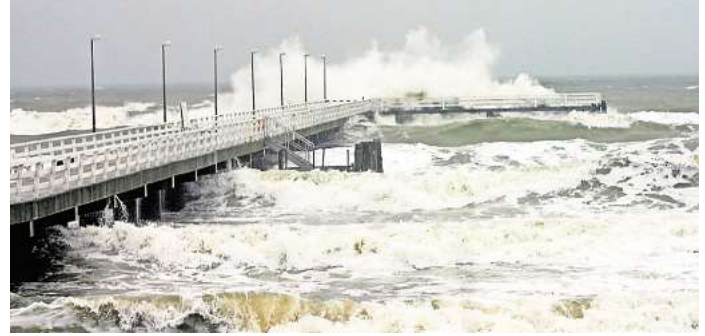
Sturm, Wellen, zeitweise auch riesige Eisschollen, haben der Seebücke so lange zugesetzt, bis sie letztendlich ersetzt werden musste.