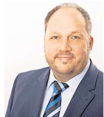
Timo Gaarz, Landrat Ostholstein.

Wenn ich darüber nachdenke, wie viele Menschen in den kommenden Jahren auf dieser Brücke besonders schöne Momente erleben werden, bin ich überzeugt, dass sich jede Mühe für dieses Bauwerk gelohnt hat. Ich bin mir sicher, dass diese Brücke nicht nur den Timmendorferinnen und Timmendorfern,