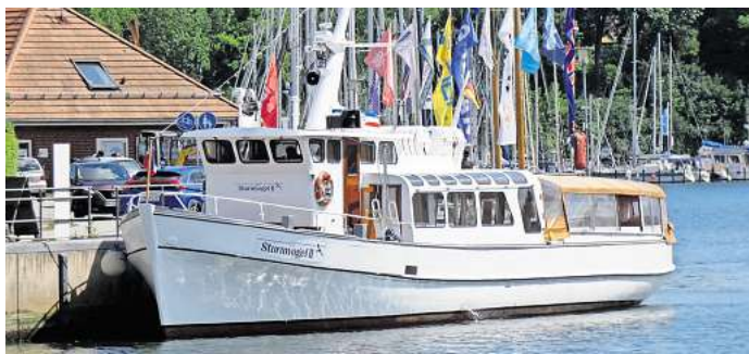
Auch die MS Sturmvogel II könnte im kommenden Jahr an der neuen Brücke anlegen. Der Eigentümer prüft derzeit, ob das möglich ist.

kündigt die Chefin an. Vielen wird das Schiff noch in Erinnerung sein, schließlich ist das maritime Schmuckstück seit 80 Jahren unterwegs.