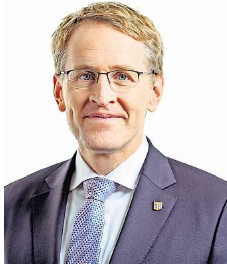
Daniel Günther (CDU), Ministerpräsident des Landes Schleswig-Holstein.

Seebrücken gehören traditionell zu vielen Orten an der Ostsee dazu. Sie