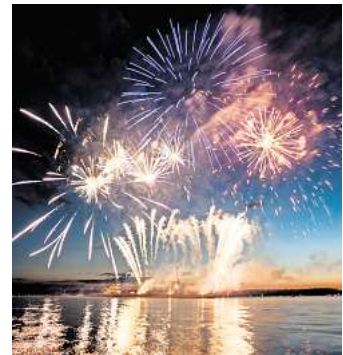
Abschlussfeuerwerk: Ab 21.45 Uhr brennt die Ostsee.