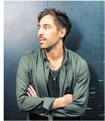
Max Giesinger (80 Millionen) ist ab 20.30 Uhr auf der Bühne.