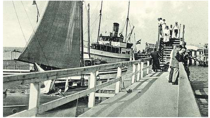
Dampfschiff angelegt: Mit der Fertigstellung der Anlegebrücke konnten die Reisegäste direkt an Land gehen – das Ausbooten wurde Historie.