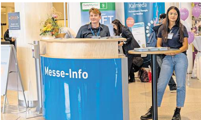
Bei allen Fragen rund um die 7. Lübecker Gesundheitstag helfen die Mitarbeiter:innen vom Lübecker Ärztenetzwerk an der Messe-Info weiter.

Willy-Brandt Allee 10, 23554 Lübeck Veranstalter: Lübecker Ärztenetz (LÄN)