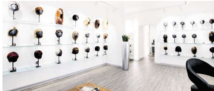
Gildhorn Haarsysteme in Selmsdorf: Dort gibt es, was Menschen nach einem Haarverlust brauchen.

Aufgrund der von den gesetzlichen Krankenkassen anerkannten Fachexpertise ist Gildhorn bei entsprechender ärztlicher Diagnose berechtigt, die Kosten für einen Haarersatz anteilig abzurechnen. Weiterhin erleichtert das Unternehmen als offizieller Partner der DKMS LIFE im Haarprogramm