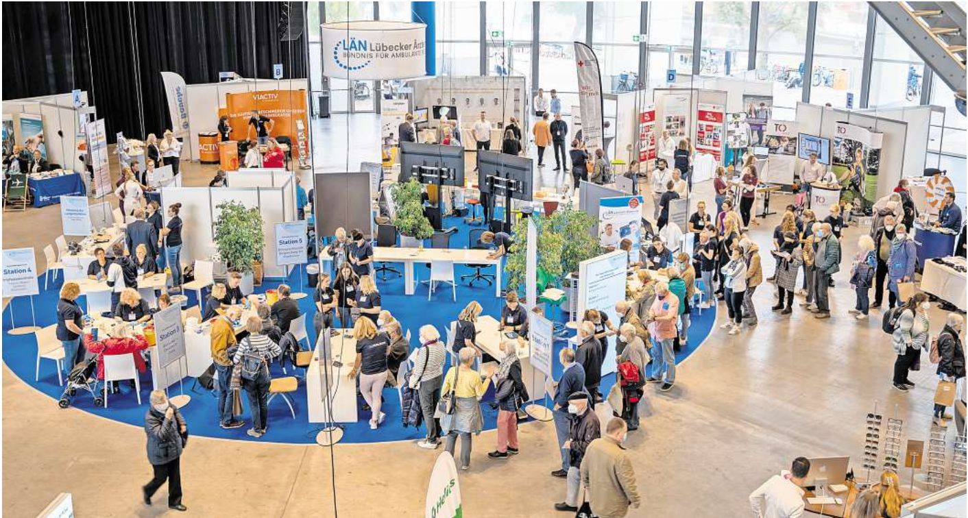
Das höchste Gut im Fokus: Im Foyer der MuK dreht sich am Sonnabend, 28. September alles um die Gesundheit.