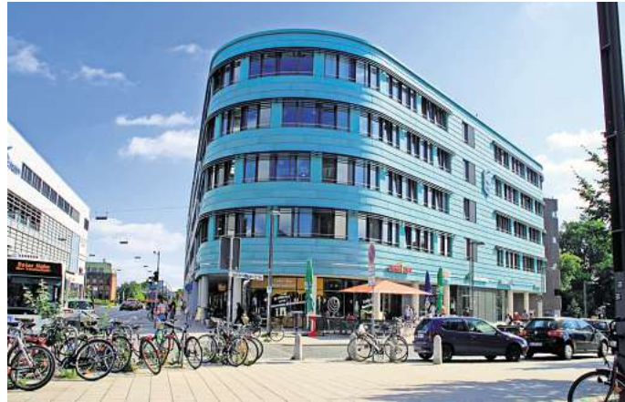
Das Vamed Rehaszentrum bewegt Lübeck.