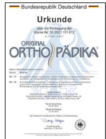
Die Urkunde des Bundespatentamtes.

sich unter www.orthopaedika.de informieren, aber unsere Beratungen sind gelebte Gesundheitsempfehlungen. Alle Mitarbeiter sind darin ausgebildet.