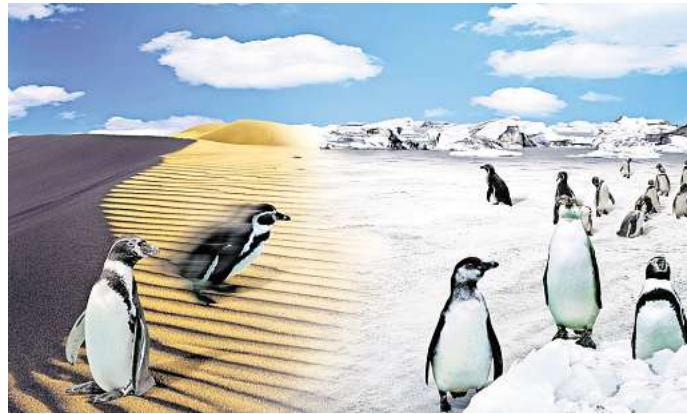
Eine effektive Kältetechnik gewinnt auch aufgrund des Klimawandels zunehmend an Bedeutung.

Für den jungen Kälteanlagenbauer bietet dieser Spe-