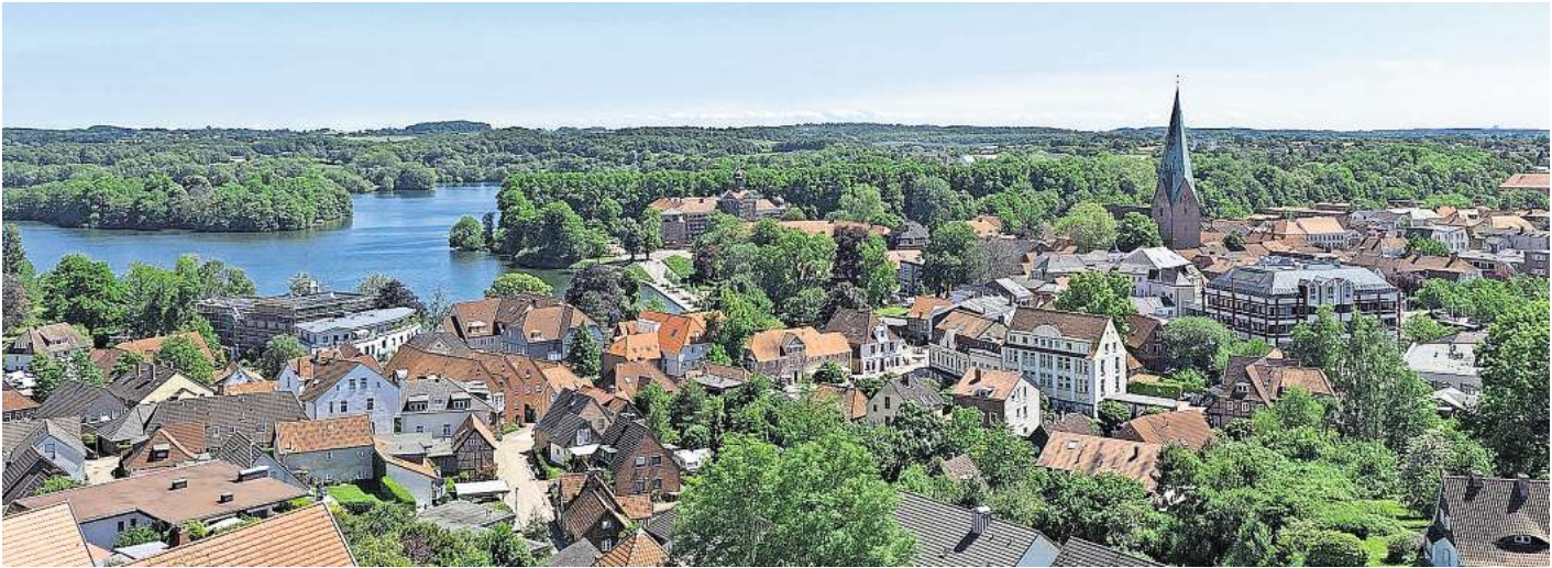
Eine Ausbildung bei der Stadtentwässerung Eutin ist ein solides Fundament für die berufliche Zukunft.