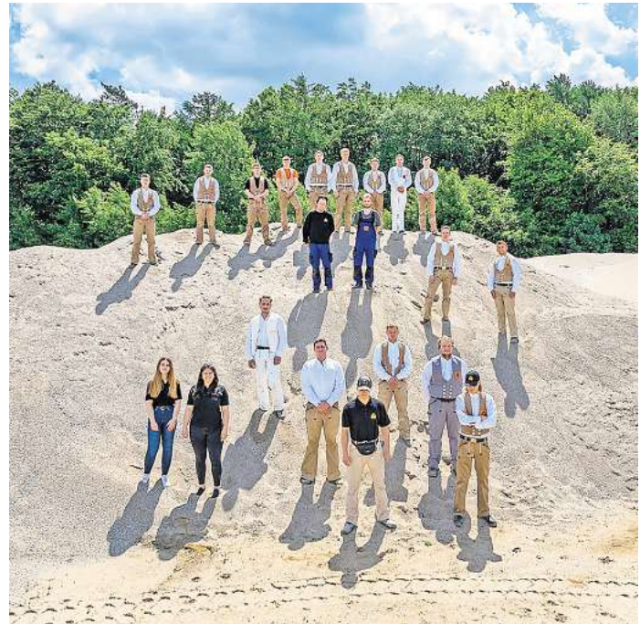
Hervorragende Karriereaussichten bei Schütt.

FRIEDRICH SCHÜTT + SOHN BAUGESELLSCHAFT GMBH & CO. KG Wisbystraße 2, 23558 Lübeck Tel. 0451/ 47 00 10, www.schuett-bau.de