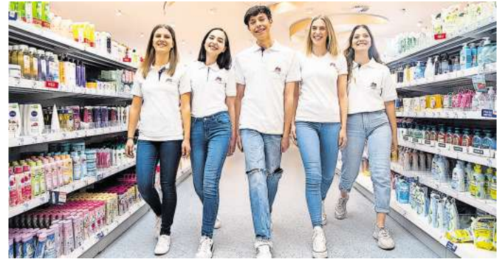
dm geht immer? Dann werde Teil in unserem Team.