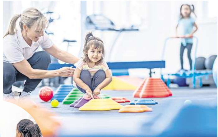
Neu an der ecolea Rostock – Ausbildungen in den Bereichen Ergotherapie und Logopädie

Ähnlich geht es zahlreichen Studieninteressierten, die ihren Ablehnungsbescheid von der Zentralen Vergabestelle für Studienplätze oder der Hochschule, bei der sie sich beworben haben, erst zu einem sehr späten Zeitpunkt erhalten. Oft