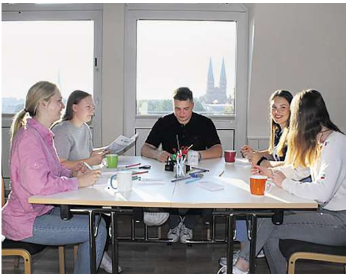
Unsere Azubis beginnen ihre Ausbildung mit der „Kennenlern-Woche“, bei der sie sich austauschen können.

Schwartauer Allee 10 23554 Lübeck Tel. 0451/14 00 849 www.die-bruecke.de