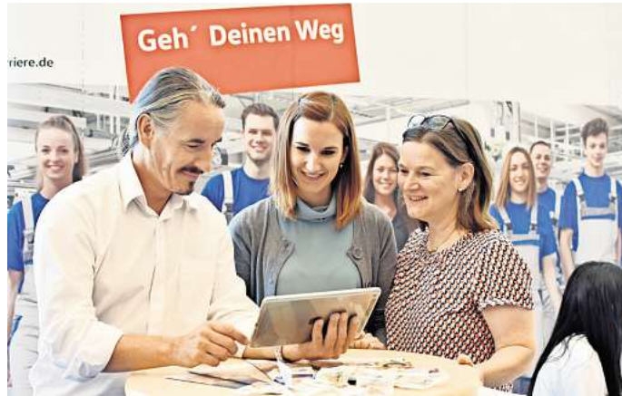
Die Berufswahlmesse parentum richtet sich gezielt am Jugendliche und ihre Eltern

Das Beratungsspektrum der Aussteller ist vielfältig. Neben Informationen zu den verschiedensten Ausbildungsberufen und Studiengängen, geht es auch um weitere Themen rund um den Übergang von Schule in den Beruf: Die Agentur für Arbeit gibt z.B. einen Einstiegsworkshop: „Ausbildungssuche digital –