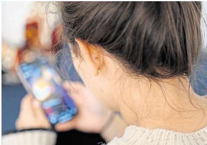
Oberflächliche Karrietipps von Influencern sollte man kritisch hinterfragen, bevor man sie anwendet.

Und Bewerber sollten sich genau überlegen, ob sie für das Unternehmen arbeiten möchten. dpa/tmn