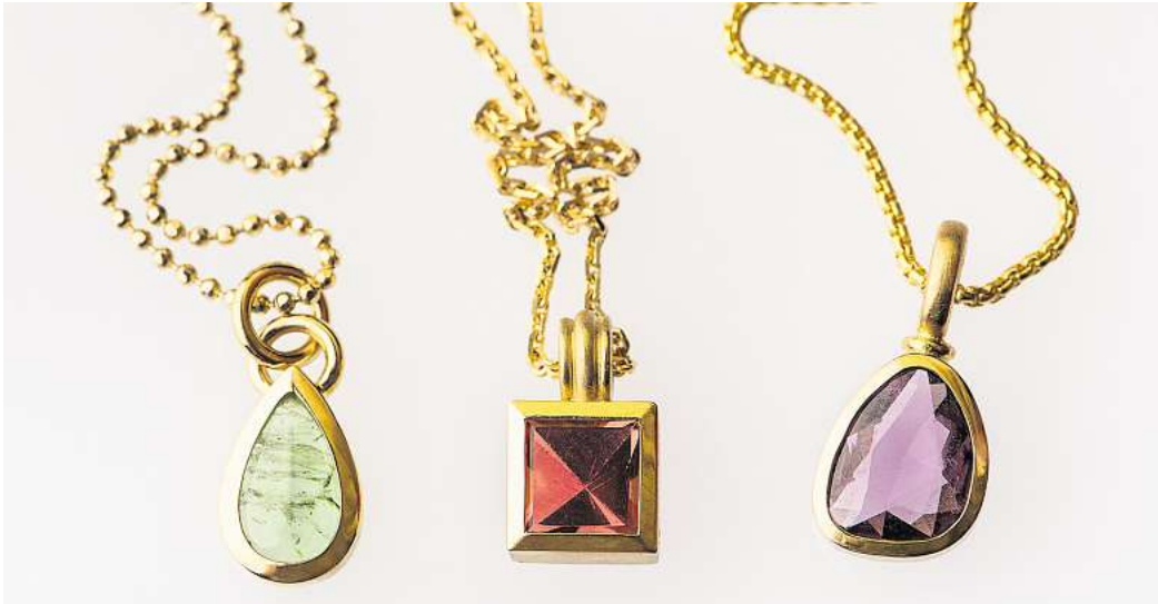
Die Goldschmiede Hardell bietet eine große Auswahl an farbigen Steinen gegen den Herbstblues.