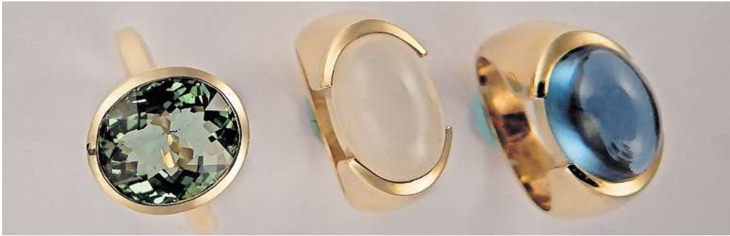
Wunderschöne Goldringe mit verschiedenen Steinen wie einem facettierten grünen Turmalin, einem Mondstein in Cabochon-Schliff oder einem Topas in London Blue mit Cabochon-Schliff betet Juwelier Jürgen Helling. Juwelier Helling