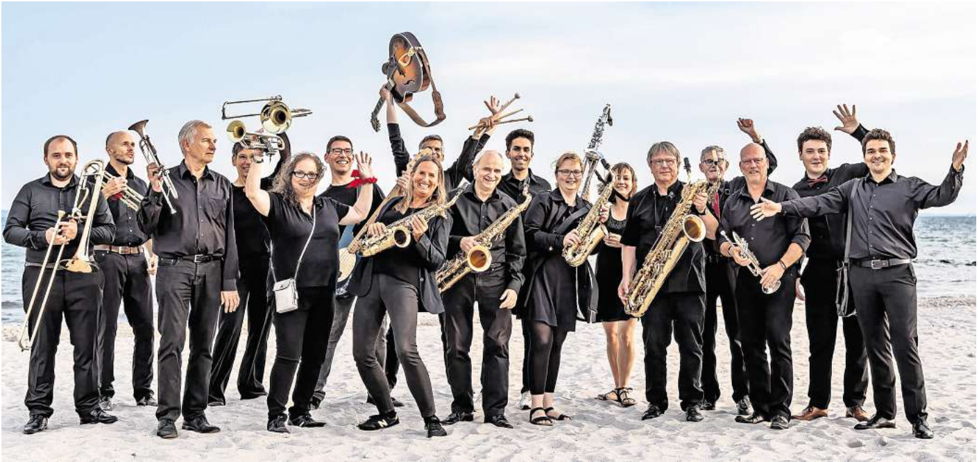
Die Big Band Bad Schwartau lädt zu ihrem Herbstkonzert in die Krummlandhalle ein.