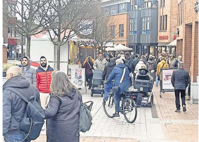
Einkaufssonntag in Bad Schwartau. Die trüben Novembertage kann man sich mit einem heißen Punsch versüßen.

Auf der Bühne wird die Band „The Crash“ in der Zeit von 13 bis 18 Uhr für musikalische Unterhaltung sorgen. Überall in der Stadt gibt es Stände mit Crêpes, Mutzen, Bratwurst oder Süßigkeiten. Für Getränke ist gesorgt. Besucher können schon auf die Weihnachts- und Winterzeit mit Punsch anglühen, ein Becher kostet zwei Euro. Auf