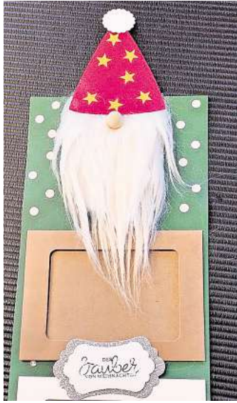
Weihnachtliche Bastelaktion für Kinder in der Aktionshütte am Europaplatz.

G rauer, kalter November. Gegen den Novemberblues gibt es am verkaufsoffenen Sonntag, 10. November, von 13 bis