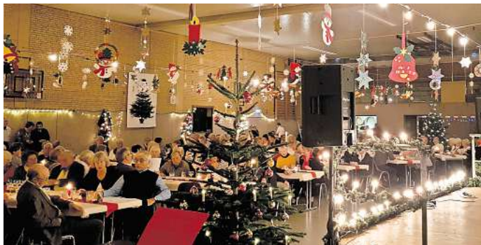
Klönssnack bei Kaffee und Kuchen bieten die Dorfvorstände an.

Einen Tag später, Dienstag, 3. Dezember, um 15 Uhr kommen die Senioren aus Luschendorf im Feuerwehrhaus in Luschendorf zur Weihnachtsfeier zusammen.