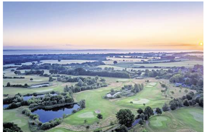
Der Maritim Golfpark Ostsee, direkt am idyllischen Hemmeldorfer See gelegen, ist unter passionierten Golfern bestens bekannt.