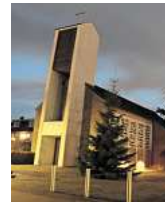
Kirche Schifflein Cristi in Sereetz.

Sonnabend, 30. Nov., 15 bis 20 Uhr: Weihnachtsmarkt auf dem Dorfplatz