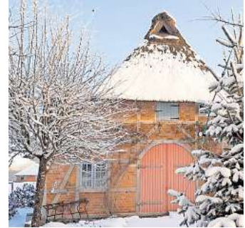
Das Dorfmuseum mit der alten Kate gehört zu Ratekau.

Jeder Beitrag hilft dabei, die historische Bedeutung des Dorfmuseums zu bewahren, die Geschichte der Gemeinde Ratekau zu bewahren und für kommende Generationen erlebbar zu ma-