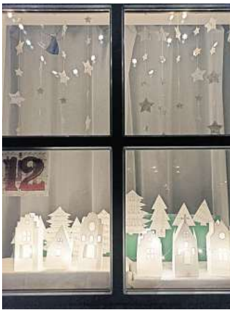
Es sind immer wieder schöne Fenster zu bestaunen beim Lebendigen Advent in Sereetz.

Die Teilnehmenden freuen sich sehr auf anregende Geschichten und Gemeinschaft im Advent. Da alles findet im Freien stattfindet, sollte sich jeder warm anziehen. Auch eine Taschenlampe ist von Vorteil und für Tee beziehungsweise Glühwein sollte jeder auch einen Becher dabei haben. Die genauen Termine und Veranstaltungsorte sind im Gemeindebrief und am Aushang im Schaukasten aufgelistet.