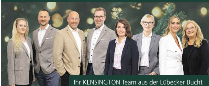
Ihr KENSINGTON Team aus der Lübecker Bucht

Wir wünschen Ihnen FROHE WEIHNACHTEN & EINEN GUTEN START INS NEUE JAHR!