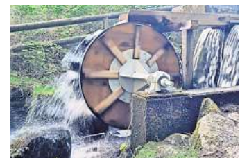
Das neue Wasserrad am Pansdorfer Mühlenteich wird beim Lebendigen Advent eingeweiht.

Das neue Wasserrad am Mühlenteich in Pansdorf dreht sich seit einige Zeit wieder. Im Rahmen des Lebendigen Advents wird die Kirchengemeinde Pansdorf es mit Bürgermeister Thomas Keller am Freitag, 6. Dezember, um 17 Uhr offiziell einweihen. Die Gemeinde Ratekau sorgt für Punsch und einen Snack. Und wer weiß... vielleicht ist auch der Nikolaus im Wald unterwegs. Groß und Klein sind