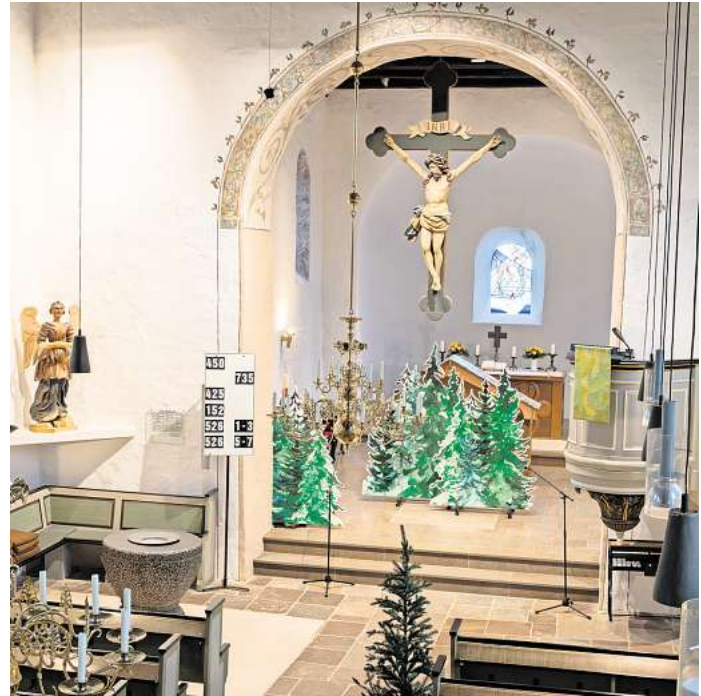
Die neue Beleuchtung der Feldsteinkirche in Ratekau leuchtet nicht nur den Altarraum besser aus und kann individuell gesteuert werden.