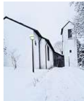
St. Michaelis Kirche in Pansdorf.