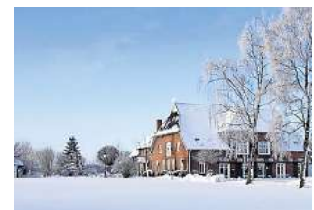
Wintergolf und Adventsbrunch am Hemmeldorfer See: Winterliche Genüsse im Maritim Golfpark Ostsee.