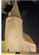
Feldsteinkirche in Ratekau.

Sonnabend, 30. Nov., 15 bis 21 Uhr: Weihnachtsmarkt im Dorfmuseum