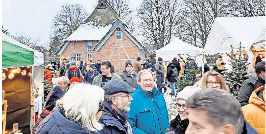
An diesem Wochenende findet wieder der Weihnachtsmarkt rund um das Dorfmuseum Ratekau statt. Dorfmuseum Ratekau

Für hungrige Besucher gibt es Stockbrot und Heißwecken aus dem Holzofen über Wurst, Crepes, Pommes und Kaffee – für jeden Geschmack ist etwas dabei. Stimmungsvoll wird es an