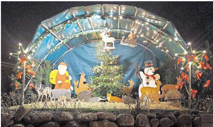
Das Ortskartell Sereetz lädt wieder zum beliebten Weihnachtsmarkt auf den Dorfplatz ein.

An gleicher Stelle veranstaltet der Dorfvorstand an Silvester von 11 bis etwa 14 Uhr ein „Warm up“ zur Silvesterparty. Bei der kleinen Goodbye 2024-Fete stimmen sich alle Gäste bei Punsch, Getränken, Bratwürsten, Berlinern und mehr auf die abendliche Sause ein und verabschieden sich mit besten Wünschen für das Neue Jahr.