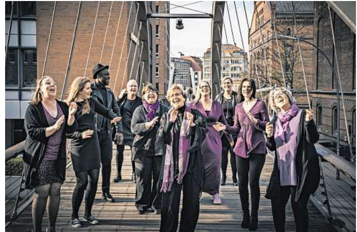
Mit fröhlichen und kraftvollen Gospelklängen leiten ForYourSoul bei ihrem traditionellen Konzert in Sereetz die Vorweihnachtszeit ein.