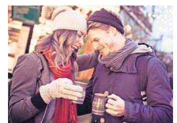
Punsch, Waffeln und vieles mehr auf dem Weihnachtsmarkt Weissenhäuser Strand.

WEITERE INFOS www.weissenhaeuserstrand.de