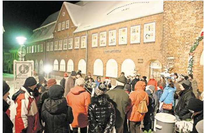
Bei einer abendlichen Veranstaltung werden die Türchen des Riesen-Adventskalenders geöffnet.

Bereits im September haben Kitas, Vereine, Schulen,