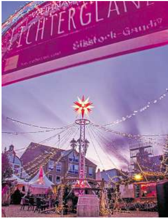
Lichterglanz in Heiligenhafen.