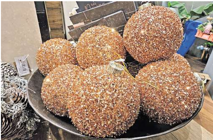
Mit Lametta oder Pailletten beklebte Weihnachtskugeln in Erdtönen lassen jeden Weihnachtsbaum zu einem Blickfang werden.

Woran man in diesem Jahr kaum vorbeikommt, sind die kleinen Herrnhuter Sterne aus der Oberlausitz. Benjamin Ehrenberger: „Sie haben eine lange Tradition und sind wieder absolut im Kommen. Sie haben eine kleine LED-Lampe und lassen jedes Haus und jedes Fenster weihnachtlich erstrahlen.“ pd