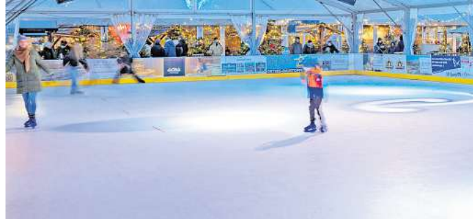
Zum Wintervergnügen lockt die Eisbahn nach Grömitz.

Neben dem klassischen Schlittschuhlaufen und Eisstockschießen lockt die neue