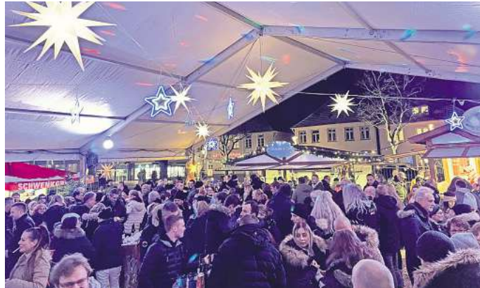
Neustadt lockt die Besucher mit dem beliebten Wintertreff.

Für den diesjährigen Wintertreff hat Ulfert Georgs ein tolles Programm auf die Beine