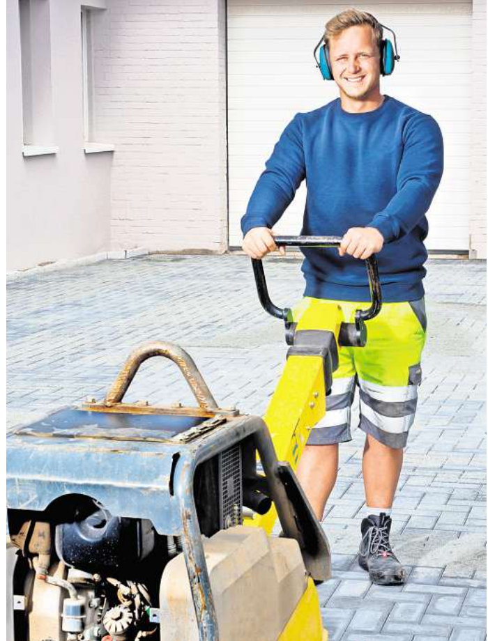
Wertarbeit mit Qualität: Im Ausbildungspark Blankensee wird die praktische Lehrlingsunterweisung.

Ausbildungspark Blankensee Am Flugplatz 4 Haus 20 23560 Lübeck Tel. 0451/ 50 40-102 geschaeftsstelle@bauinnung-luebeck.de