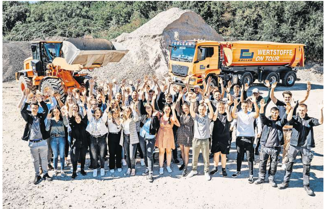
Teambuildingmaßnahmen, wie gemeinsame Messeprojekte oder Besichtigungen der firmeneigenen Produktionsanlagen bringen die Azubis der unterschiedlichsten Ausbildungsberufe zusammen.

Die Unternehmensgruppe Gollan bildet an fünf Standorten aus, wobei insbesondere die kaufmännischen Azubis entsprechend ihrer persönlichen Neigungen und Talente sowohl in die technische, logistische oder kaufmännische Richtung Entwicklungspotentiale finden.