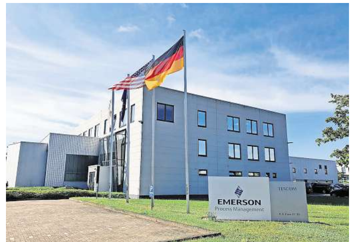
EMERSON produziert am Standort in Selmsdorf Komponenten und Systeme für Druckregelungen von Gasen und Flüssigkeiten.