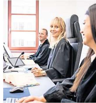
Das Land Schleswig-Holstein bietet mehr als 30 verschiedene Ausbildungsberufe und duale Studiengänge an.

Und wir bieten dir Einiges: Faire Bezahlung, flexible Arbeitszeitmodelle und beste Chancen zur beruflichen Weiterentwicklung. Das Land Schleswig-Holstein ist der größte Arbeitgeber im echten Norden – unsere Kolleginnen und Kollegen sind überall zwischen Nord- und Ostsee tätig. Ob in Flensburg, Elmshorn, Husum oder Lübeck, wir bieten dir span-