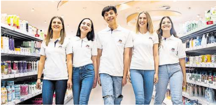
dm geht immer? Dann werde Teil in unserem Team.