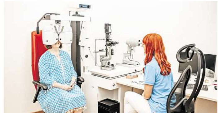
Eine Augenmessung gehört zu den täglichen Untersuchungen des medizinischen Fachpersonals.

Uta Dünnebeil Markt 1, 23552 Lübeck Tel. 0451/ 31 70 06 31 E-Mail: bewerbung@hanseblick.com