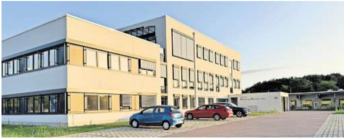
Das Hoeger und Partner Firmengebäude in Eutin.