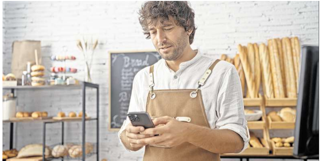
Smarte Technologien wie die Smart Bakery Box erleichtern die Arbeit in der Bäckerei

Längst hat die Digitalisierung auch im Bäckerhandwerk Einzug gehalten. Die Smart Bakery Box zum Bei-