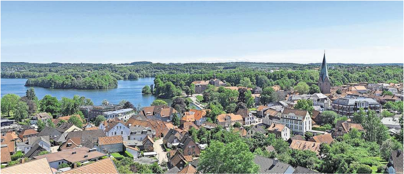
Eine Ausbildung bei der Stadtentwässerung Eutin ist ein solides Fundament für die berufliche Zukunft.