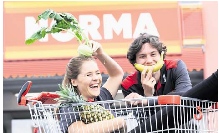
Bei NORMA bekommen junge Menschen eine berufliche Zukunft.

Niederlassung Dummerstorf Frau Zander Manfred-Roth-Straße 1, 18196 Dummerstorf Dum.ausbildung@norma-online.de