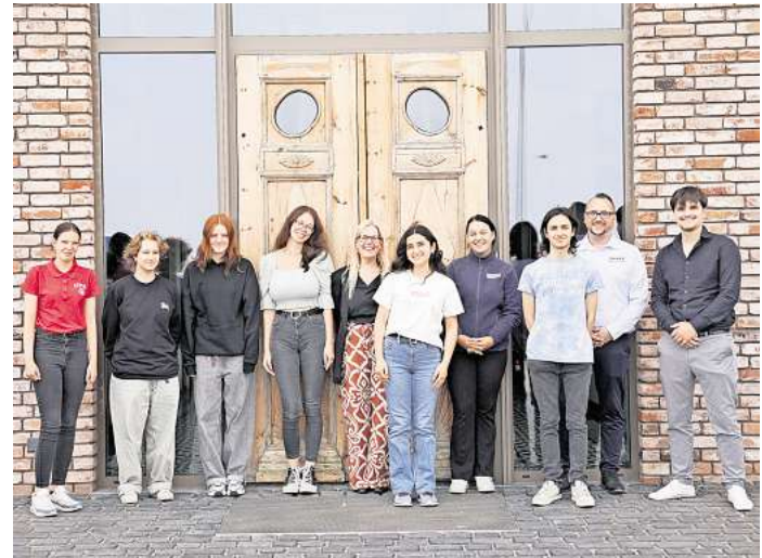
Diese jungen Nachwuchskräfte des Familienunternehmens Martin Stolz freuen sich auf neue Kolleginnen und Kollegen.

Personalabteilung Am Markt 2-6, 23769 Fehmarn