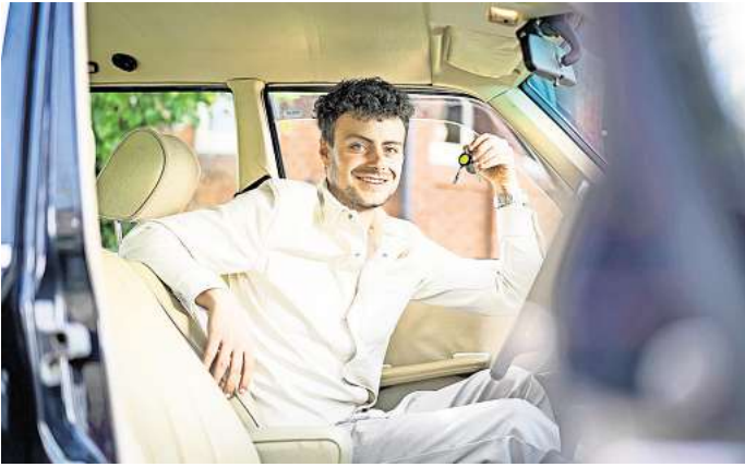
Gib Vollgas in deiner Ausbildung bei OCC.