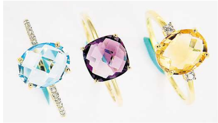
Farbschmucksteine faszinieren durch ihre natürliche Schönheit und Vielfalt, sie gelten als begehrte Symbole für Eleganz und Ausdruckskraft.

Darüber hinaus wird mit der Aktion „Respekt für Retter“ auf ein angemessenes Verhalten gegenüber den Mitarbeiterinnen und Mitarbeitern der so genannten „Blaulichtberufe“ – Feuerwehr, Polizei, Rettungskräfte – hingewiesen. Der Appell: Behandelt Menschen, die helfen und Leben retten, mit Anstand, Respekt und Wertschätzung.