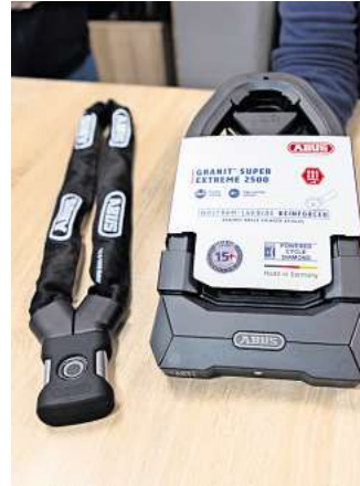
Sichere Schlösser von Abus mit Fingerabdrucksensor (links) und aus Wolframcarbid mit Level 15+ (rechts) sind beim Drahtesel erhältlich.