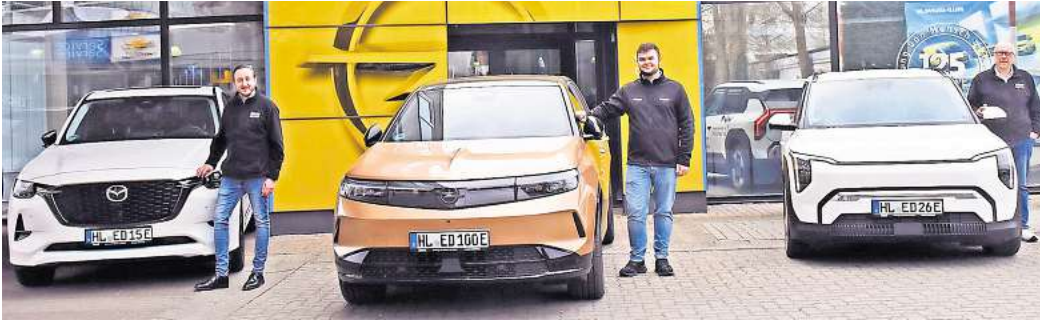
Das Team vom Autohaus Dello zeigt die Marken Opel, Kia und Mazda am Sonntag in Bad Schwartau.

Autohaus Dello präsentiert sechs Modelle am verkaufsoffenen Sonntag