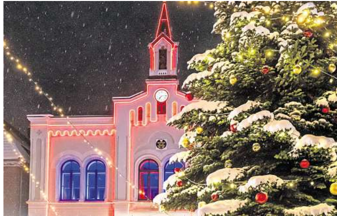
Der Oldenburger Weihnachtstreff auf dem Rathausplatz.

Der Wirtschafts- und Fremdenverkehrsverein hat für eine neue Beleuchtung des Weihnachtsbaumes gesorgt, das Stadtmarketing unterstützt die Veranstaltung.