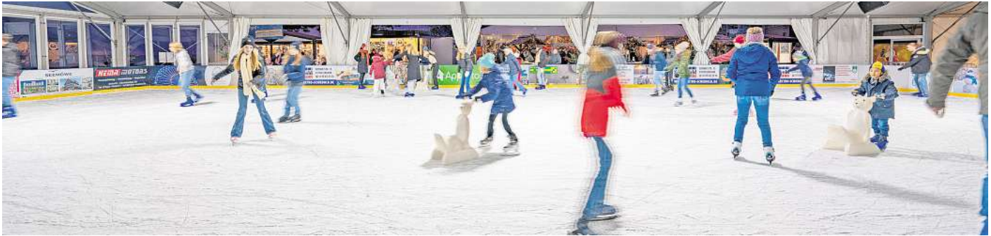
Eiszeit in Grömitz: -Die Eisbahn ist noch größer geworden für unbeschwertes Schlittschuhlaufen. Neu ist eine Eisstockbahn hinzugekommen.