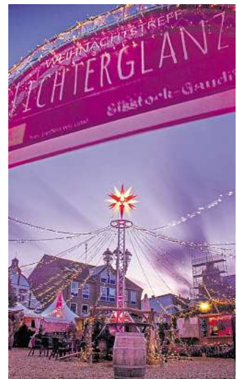
Der Markt in Heiligenhafen.

Geöffnet ist er Weihnachtstreff „Lichterglanz“ täglich ab etwa 12 Uhr, dienstags ist Ruhetag. bg