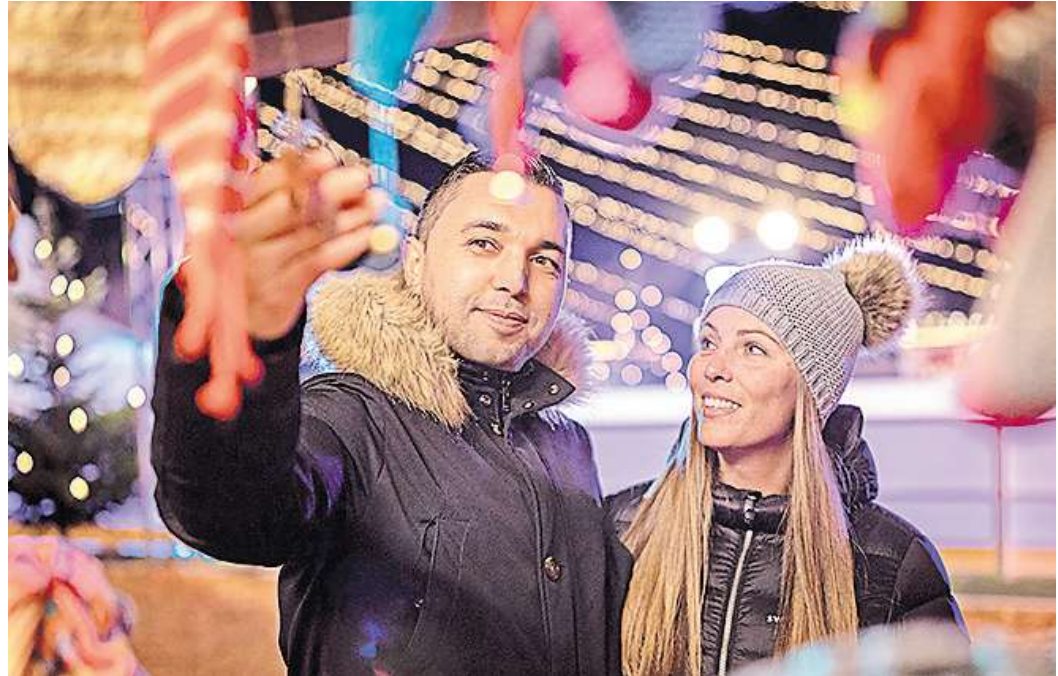
Der Weihnachtsmarkt Weissenhäuser Strand startet am 5. Dezember.

Selbstverständlich locken auch die anderen beliebten Attraktionen: Das Subtropische Badeparadies mit Norddeutschlands längster Welle, 13 rasanten Rutschen und der Wasserspiellandschaft Water World. Große und kleine Abenteuerer können im Abenteuer Dschungelland auf Entdeckungsreise gehen und Kai-