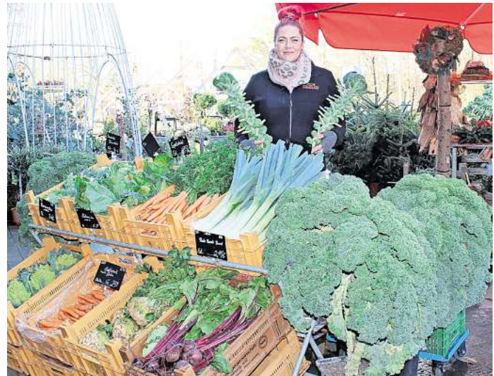
Die Oldenburger Markthalle bietet eine bunte Auswahl an Kohl und anderen Gemüsesorten.