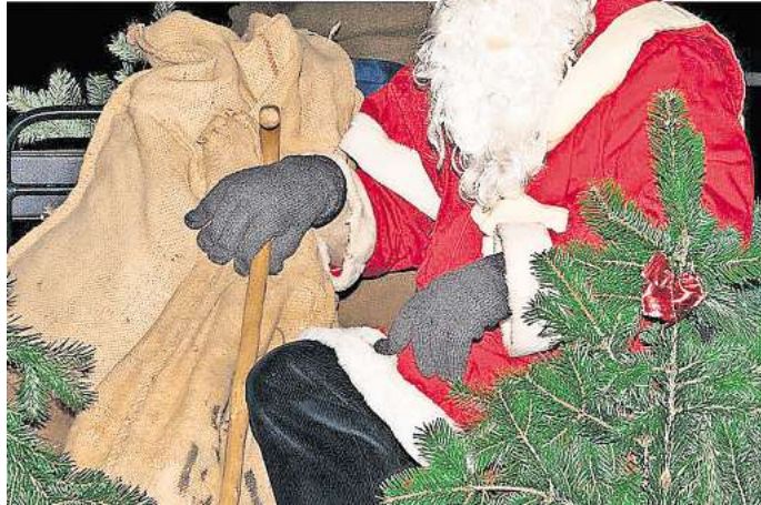
Der Weihnachtsmann kommt auch nach Grube.

14 Künstler aus Ostholstein haben für den Gruber