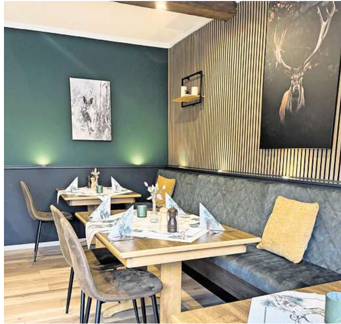
Die stilvolle Inneneinrichtung im Gruber Hof.

Der Gruber Hof bietet nicht nur Platz zum Essen – son-