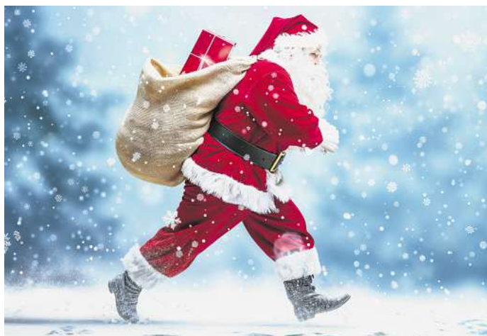
Echte Weihnachtsmänner werden gemacht.