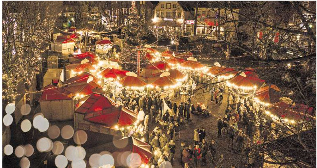
Heute eröffnet der Weihnachtsmarkt auf dem Burger Marktplatz.

Dort öffnet der Fehmarnsche Weihnachtsmarkt seine Tore und verwandelt das historische Zentrum in ein kleines Wintermärchen. In liebevoll geschmückten Holzbu-