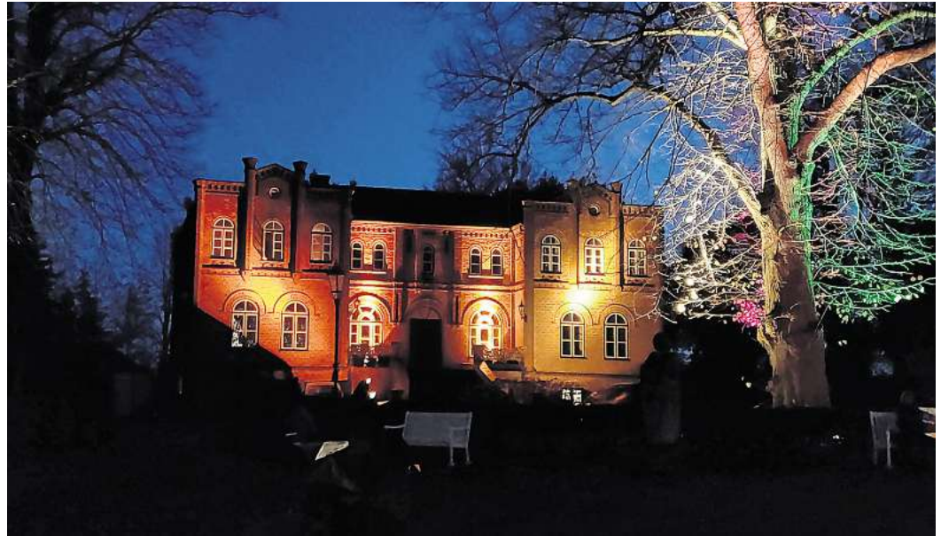
Weihnachtsshoppping: Gut Görtz lädt zu einem Besuch in der Adventszeit ein.