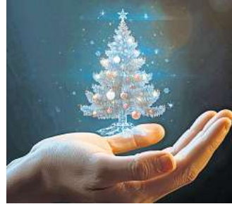
Nele arbeitet am stereoskopischen Display, vergrößert per Sprachbefehl den Holo-Weihnachtsbaum und dekoriert ihn mit einem Digitalstift.

„Steht bei euch Gottesdienst an?“ Oma: „Ja, die Kirche streamt wie immer als Avatar-Per-