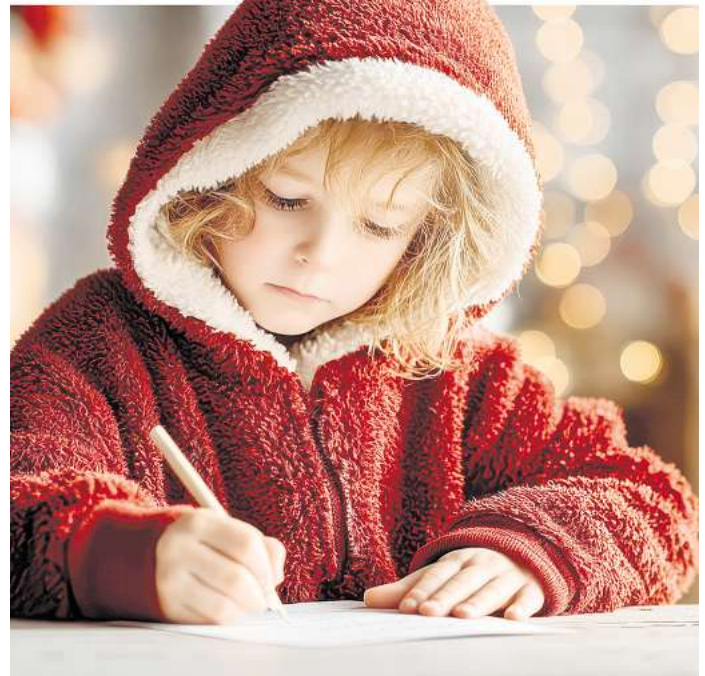
Das Weihnachtspostamt im Himmelpfort ist eröffnet. Im vergangenen Jahr gingen dort rund zwölf Tonnen am Post ein.