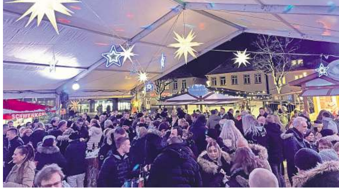
Der Wintertreff in Neustadt ist auch überdacht.