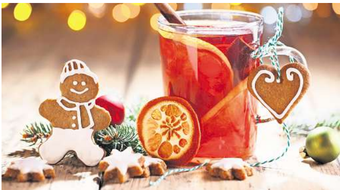
Ungünstige Kombination: Punsch und Co. enthalten viel Zucker, und Alkohol hemmt die Fettverbrennung.

Besonders heimtückisch ist, dass diese Lebensmittel