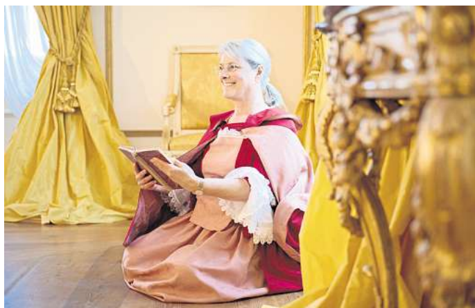
Für Familien gibt es Märchenführungen im Schloss.

In der Weihnachtszeit können Gäste einen ruhigen, stimmungsvollen Tag im