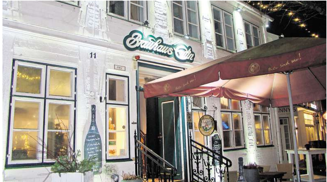
Gemütlich bis feierlich: Das Brauhaus Eutin direkt am Markt wird im Advent zum winterlichen Treffpunkt.

Menüs sowie Gerichte à la carte angeboten. Und Neujahr kann man das Jahr 2026 von 12 bis 22 Uhr begrüßen.