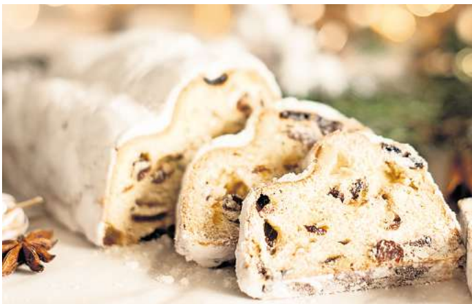
Durch viel Butter, Nüsse und Trockenfrüchte steckt in einer Scheibe Stollen mehr Energie als meist vermutet.

Am Ende bleibt die Vorweihnachtszeit ein Fest der Sinne; dazu gehört auch das gemeinsame Genießen. Wer jedoch die größten Kalorienfallen kennt, versteht besser, warum kleine Portionen oft so große Wirkung haben. Mit etwas Achtsamkeit lässt sich der Advent voll auskosten, während sich das Gewicht stabil hält und der Genuss dennoch nicht zu kurz kommt. ots