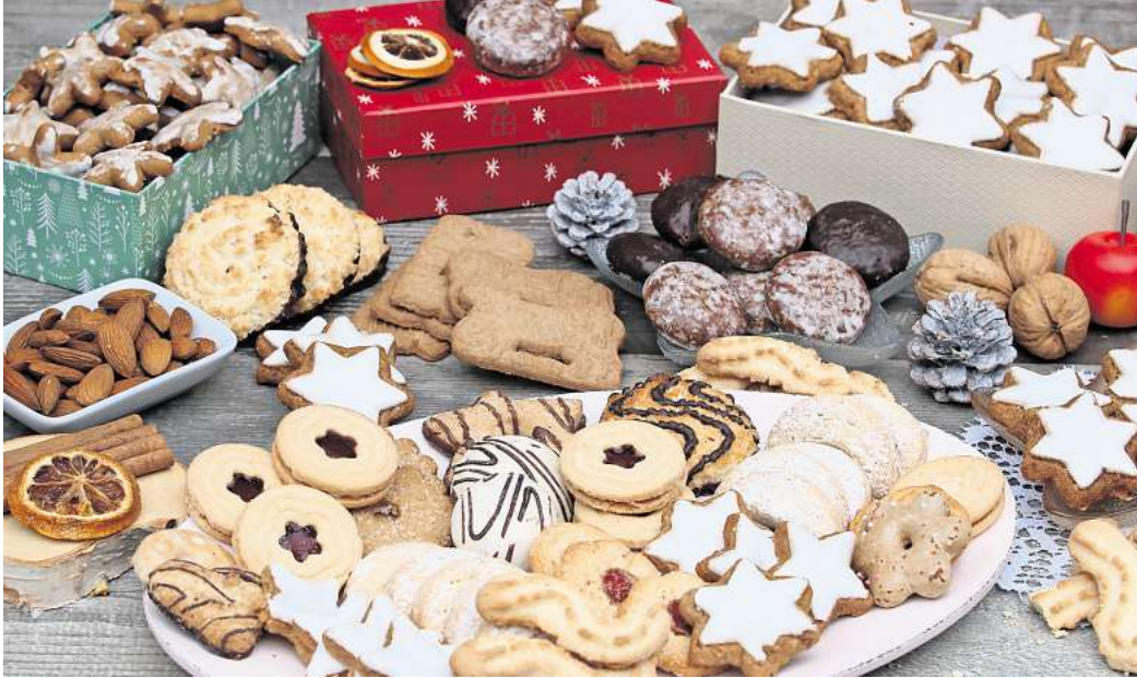
Spekulatius, Zimtsterne und Makronen liefern durch hohen Fett- und Zuckergehalt viele Kalorien.

Wer unbemerkt jeden Tag zugreift, legt nicht selten schon vor dem Fest einige Kilo zu