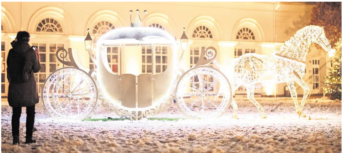
Die Kutsche vor dem Ostholstein-Museum begeistert die Besucher der Lichterstadt Eutin immer wieder aufs Neue.

Parallel zur Lichterstadt eröffnet in diesem Jahr auch wieder der Weihnachtsmarkt, der in malerischer Kulisse auf den Schlossterrassen vor dem Schloss Eutin stattfindet. Schon zur Eröff-