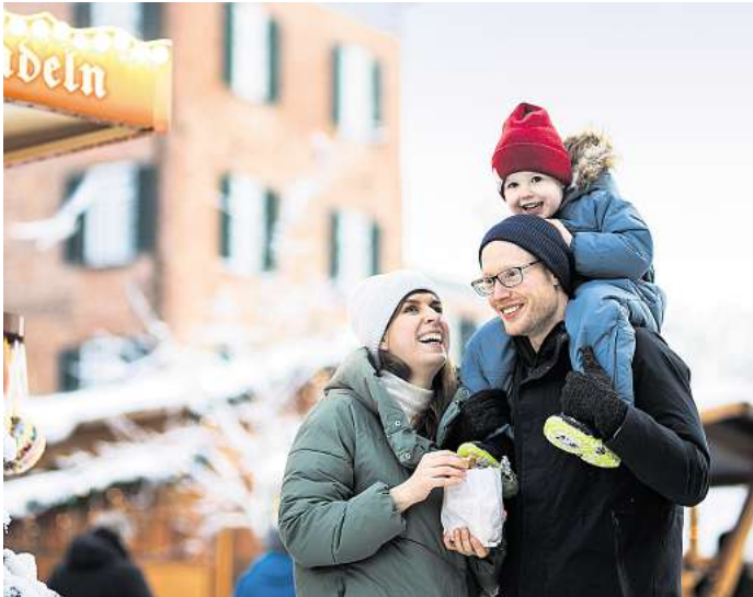
Am 21. Dezember lädt Eutin zum verkaufsoffenen Sonntag ein.