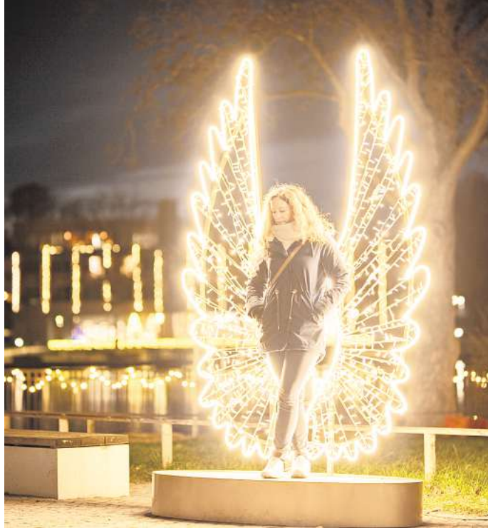
Der Selfiepoint steht direkt an der Stadtbucht in Eutin.

Im Jahr 2023 lag der Fokus auf dem größten Ballsaal Norddeutschlands, der auf dem Eutiner Marktplatz ent-