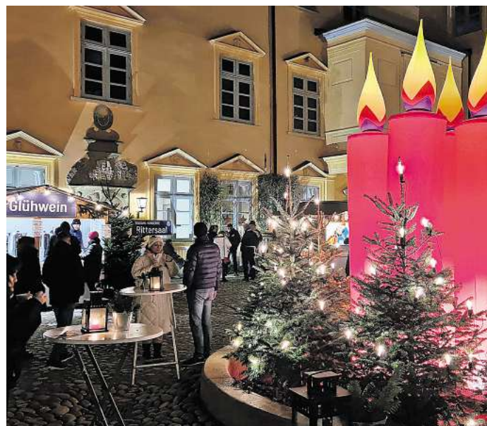
Festliche Abendstimmung bei der Weihnacht im Schloss.