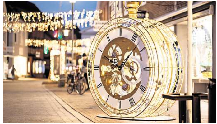
Eine illuminierte Uhr symbolisiert die Zeitreise bei der Lichterstadt.