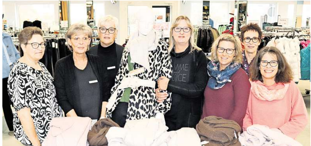
Wer eine große Auswahl bei Markenkleidung und eine gute Beratung wünscht, besucht Holtex in Eutin.

„Wir führen namhafte Hersteller.“ Tom Tailor, Camp David, Gabor, Ross oder Schiesser sind nur einige Namen. „Es hat sich herumge-