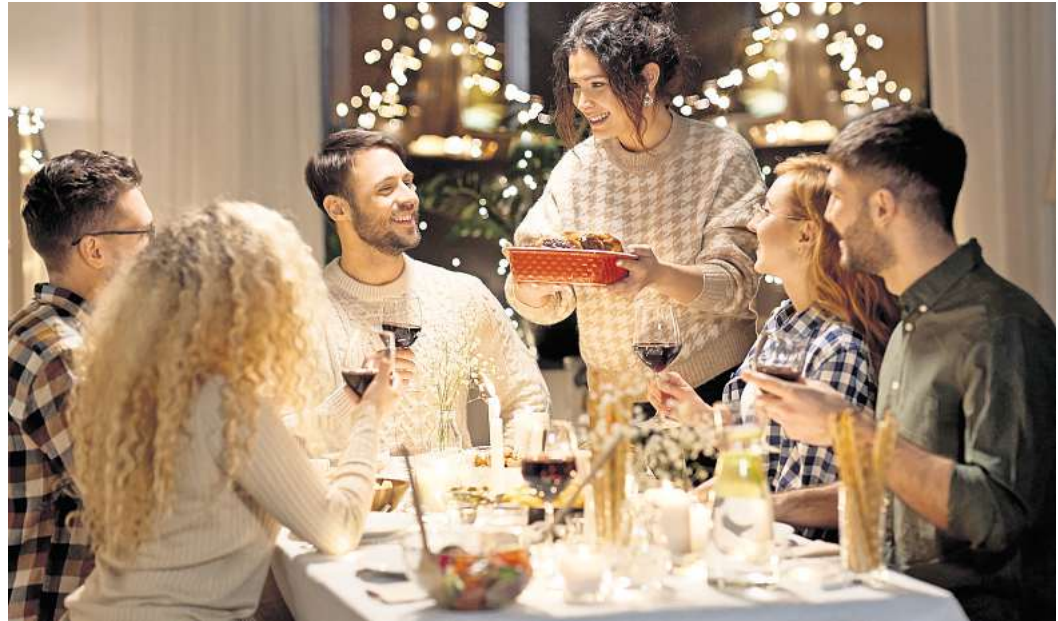
Im Advent spielt Genuss eine große Rolle – doch nicht selten wird das auf der Waage sichtbar.

Neben den bekannten süßen Klassikern zur Weihnachtszeit lauern viele weitere Kalorienfallen, die häufig unterschätzt werden. Stollen etwa enthält durch reichlich