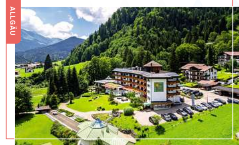
Alpenhotel Oberstdorf 4-Sterne Superior