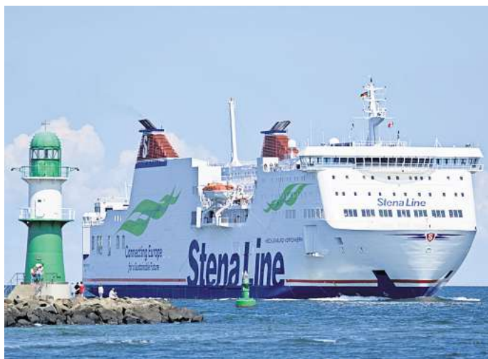
Komfortabel und stressfrei von Rostock nach Trelleborg oder von Kiel nach Göteborg gelangen – Stena Line macht es möglich.

Die Route von Kiel nach Göteborg führt direkt in Schwedens zweitgrößte Stadt. Göteborg begeistert mit seinem maritimen Flair, gemütlichen Cafés und attraktiven Einkaufsmöglichkeiten. Wer möchte, kann entlang der Kanäle spazieren, den Vergnügungspark Liseberg besuchen oder die malerischen Schäreninseln erkunden. Die Stadt verbindet Kultur, Natur und Lebensfreude auf einzigartige Weise.