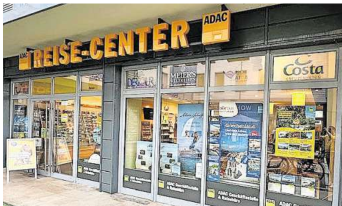
Ein Besuch des ADAC Reise-Centers in Lübeck ist für viele Menschen der Start in den Urlaub.