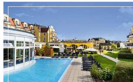
Hotel zur Post 4-Sterne Superior