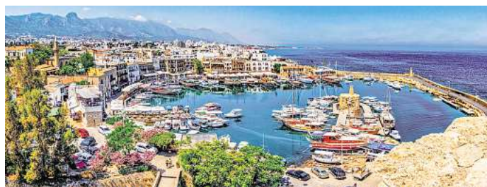
Der Hafen von Kyrenia auf Zypern ist nur einer der faszinierenden Zielorte aus dem Katalog des Reising Hamburg.

Eine Kostprobe gefällig? Wie wäre es mit einem Frühlingsbesuch in Heidelberg, einem Osterurlaub in Bad Hofgastein, einem Konzert von Roland Kaiser auf der Waldbühne Berlin oder einer Reise an den Vierwaldstätter See? Ebenso locken mediterrane Erlebnisse am Comer