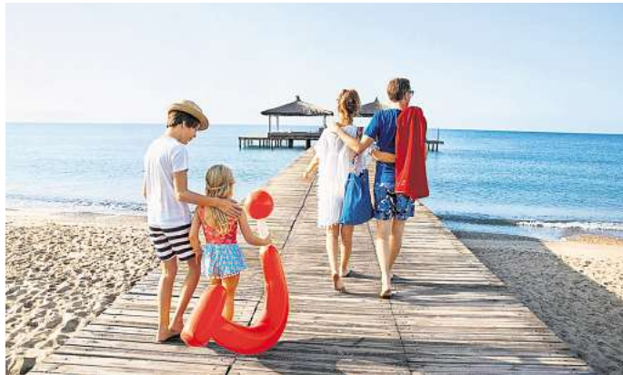
Ob Städtetrip, Kreuzfahrt oder Strandurlaub – die Reisespezialisten bei TUI finden für jeden Kunden stets das passende Angebot.