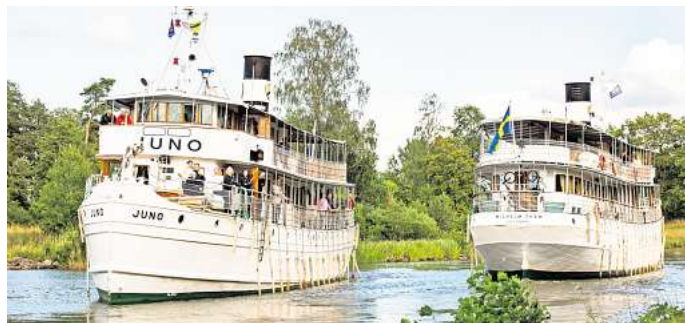
Schwedens „Blaues Band“ – eine Reise auf dem Göta Kanal ist für viele Menschen ein Lebenstraum.

im März an Bord des Hurtigrutenschiffes MS Midnatsol auf die norwegische Postschiffroute, bei der die Reisegäste den norwegischen Winter in all seinen Facetten genießen können. Man bekommt an Bord des Schiffes vielfältige und unglaubliche Wintervariationen an Land und auf See geboten, die man einfach gesehen haben muss. Und wenn dies noch vom