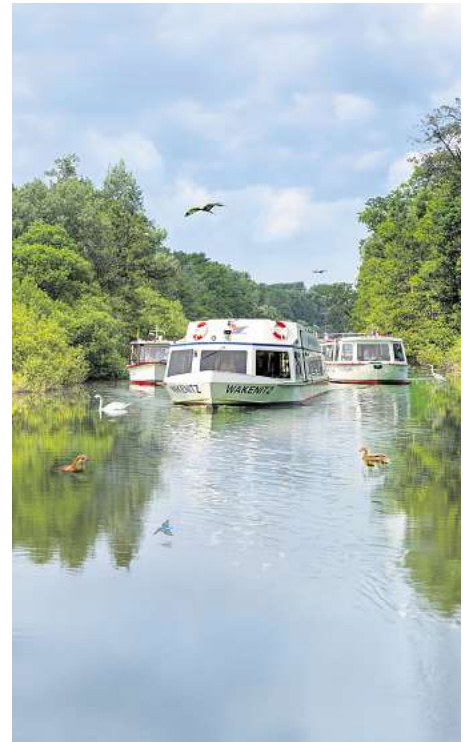
Natur, Geschichte und Genuss erleben – an Bord der Wakenitz Schifffahrt Quandt.