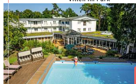
Villen im Park 4-Sterne

T +49 (0)38378 49 990 • E reservierung@rovell-hotels.de