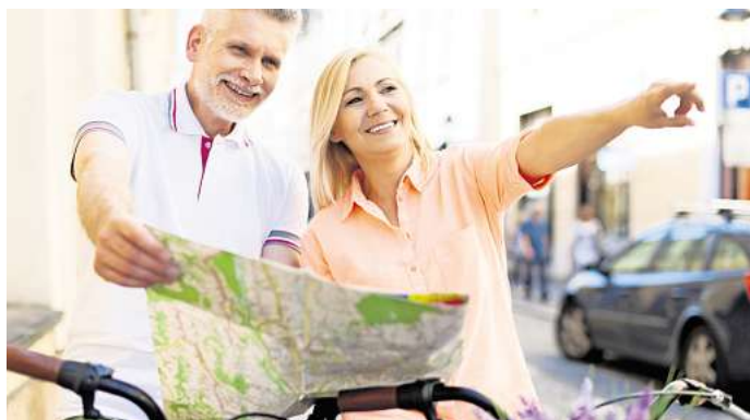
Die Welt einmal anders entdecken: Der Fahrrad-Spezialist MTB-Market schickt seine Kunden auf ganz besondere Reisen.

Für viele Kundinnen und Kunden ist das Fahrrad längst mehr als nur ein Fortbewegungsmittel. Es ist Freiheit, Naturerlebnis und Lebensgefühl – gerade auf Reisen. Mit dem Rad lassen sich Landschaften intensiver erleben, neue Orte entschleunigt ent-