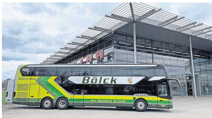
Mit dem Fünf-Sterne-Bistrobus von Bölck wird jede Reise zu einem unvergesslichen Erlebnis, das weit über das Gewöhnliche hinausgeht.

W illkommen an Bord des Fünf-Sterne-Bölck-Bistrobusses – der Inbegriff von Komfort, Stil und Erlebnis auf vier Rädern. Beim Reisedienst Bölck wird Reisen nicht nur organisiert, sondern perfektioniert. Das Unternehmen hat es sich zur Aufgabe gemacht, die Urlaubsreise von Anfang an zu etwas ganz Besonderem zu machen – mit einem Reisebus, der neue Maßstäbe setzt.