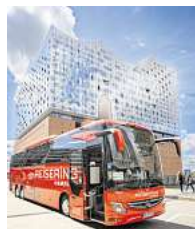
Komfortabel reisen im roten Bus.

Auch der passende zertifizierte Vier-Sterne-Reisebus steht zum Probesitzen direkt vor dem Messe-Eingang bereit. „Wie funktioniert die Haustürabholung? Sitzt man hinten genauso bequem wie vorne? Werden ausreichend Pausen gemacht und gibt es eine Toilette an Bord?“ Diese und viele weitere Fragen beantwortet das erfahrene Reisebüroamteam am Stand E1 in der Flughafenhalle gerne persönlich. Im netten Gespräch mit dem Busfahrer