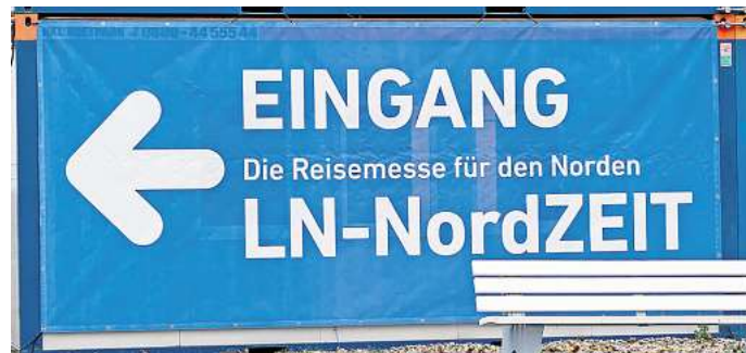
Da geht's lang. Die dritte Nordzeit-Reisemesse steht vor der Tür.

Öffnungszeiten: Die LN-NordZeit Reise- und Freizeitmesse ist am Sonnabend, 15. November und Sonntag, 16.